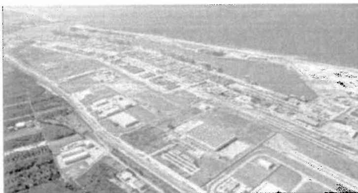
Il porto di Gioia Tauro visto dall'alto

struttura di coordinamento tra Governo, istituzioni regionali e locali presso la Presidenza del Consiglio, così da porre fine ai lunghi contenziosi tra autorità concorrenti. Accanto alla Zes, occorrerebbe inserire il porto in una delle filiere territoriali logistiche individuate dalla Svimez, quale insieme di attività commerciali e logistiche, che importano via mare materie prime e semilavorati, li lavorano e ri-esportano sempre via mare, creando valore aggiunto, crescita e occupazione. Per potenziare il mercato interno è necessario inoltre dotare il porto di scambi intermodali porto-ferrovia e di strutture logistiche di servizio. Un primo ambito di intervento potrebbe interessare l'integrazione tra l'Area vasta della città della Piana, che va da Gioia Tauro verso Lamezia, con l'aeroporto internazionale, l'autostrada del Sole, la ferrovia tirrenica e la realizzazione del rigassificatore della piastra del freddo. La riduzione delle tasse di ancoraggio e portuali potrebbe favorire gli investimenti anche stranieri nell'area. Andrebbe anche verificato con le Ferrovie Italiane l'impegno verso il trasporto delle merci, in corrispondenza del rinnovo del Contratto Nazionale di Programma».